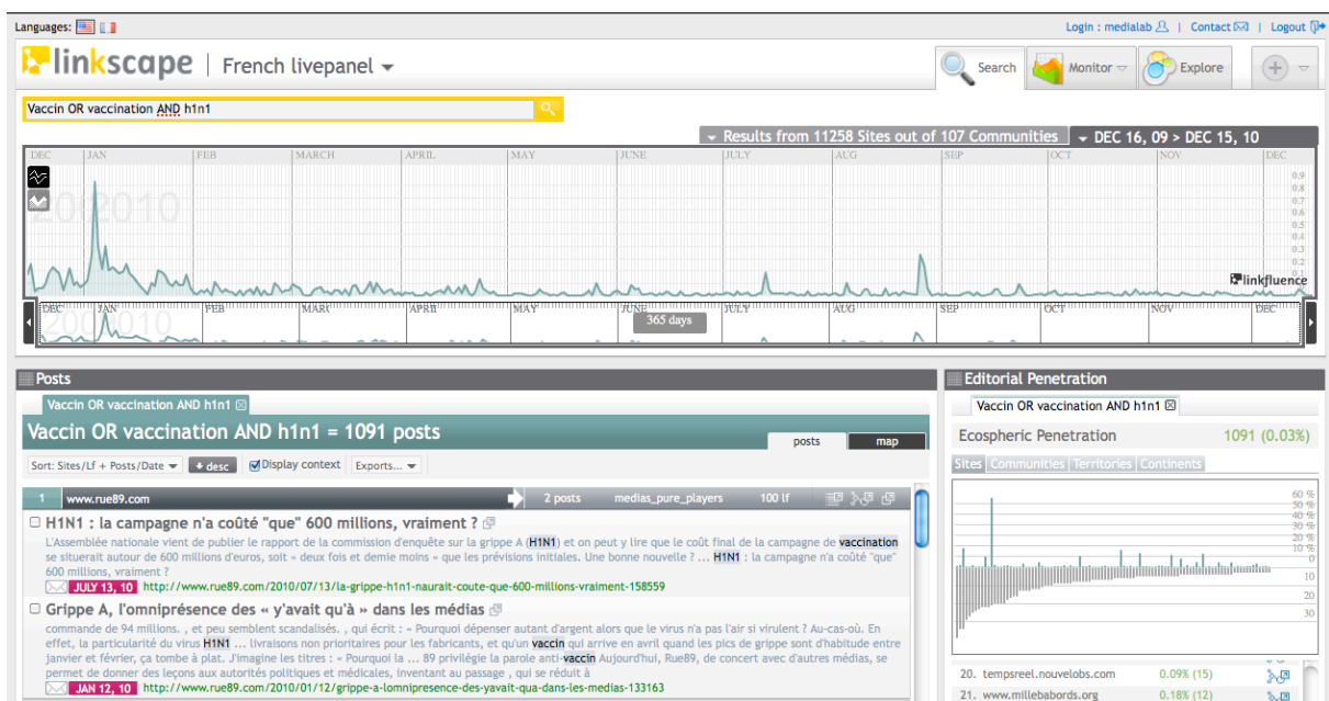
Fig 1. Exploration des billets des blogs français mentionnant le mot H1N1 et le mot vaccine ou vaccination.

Aujourd'hui, les chercheurs n'ont pas besoin de se poser la question. Grâce aux traces numériques, ils peuvent observer dans les détails les interactions d'une vaste population d'individus. On peut par exemple recueillir sur le web toutes les conversations autour de la vaccination H1N1. Ou encore on peut s'adresser à un des nombreux services commerciaux offrant ce type de veille. Ici, par exemple, l'excellent service offert par la société Linkfluence, un des partenaires du médialab de Sciences Po :